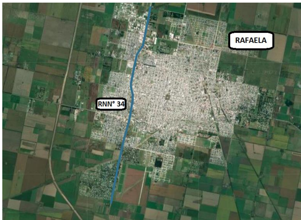
Imagen 2 – Imagen Aérea de RNN° 34 – Entre Km. 217,00 y Km. 225,00