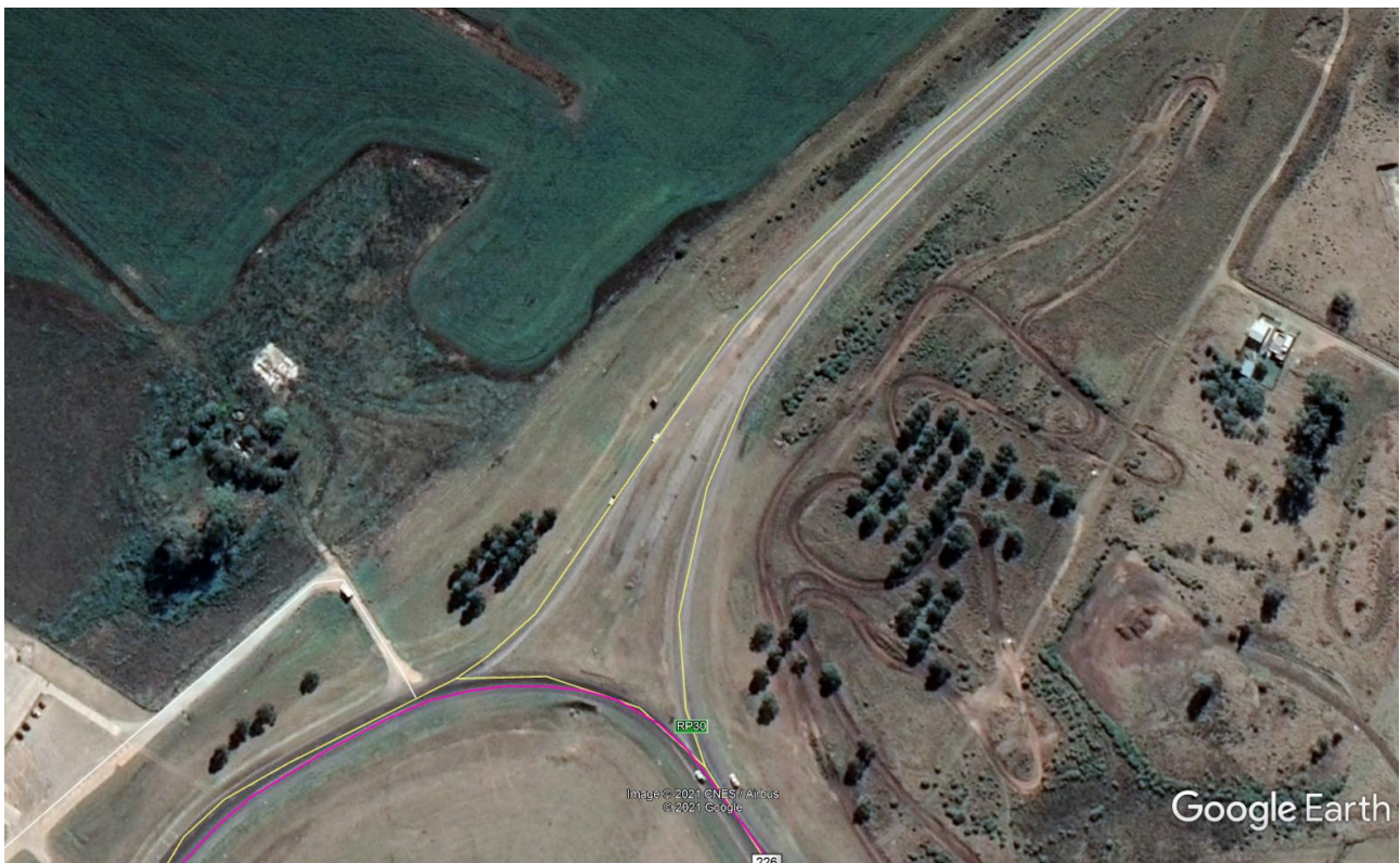
Imagen 5: Foto Aérea Acceso Norte Rotonda