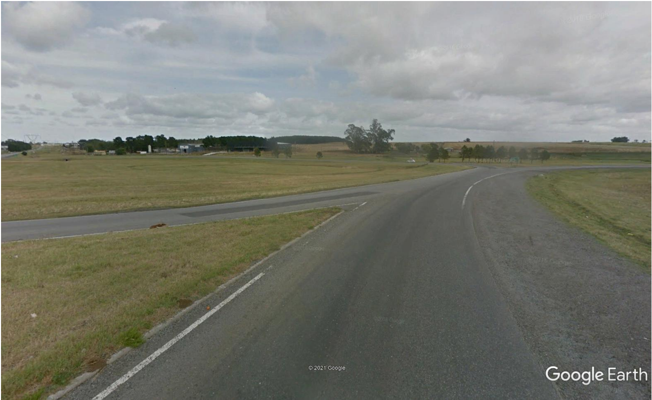
Imagen 10: Ramal de Entrada Rotonda Este