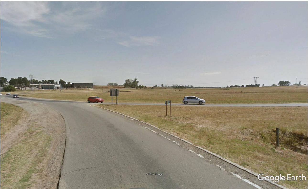
Imagen 13: Ramal de Salida de Rotonda hacia Sur