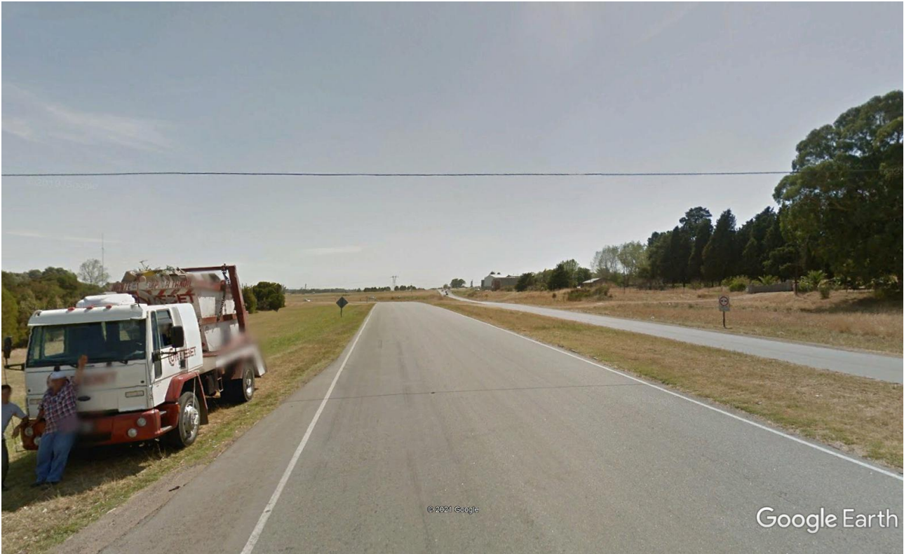
Imagen 12: Acceso Sur