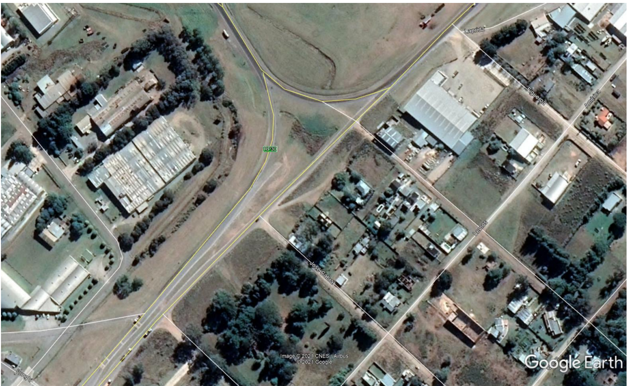
Imagen 11: Foto Aérea Acceso Sur Rotonda