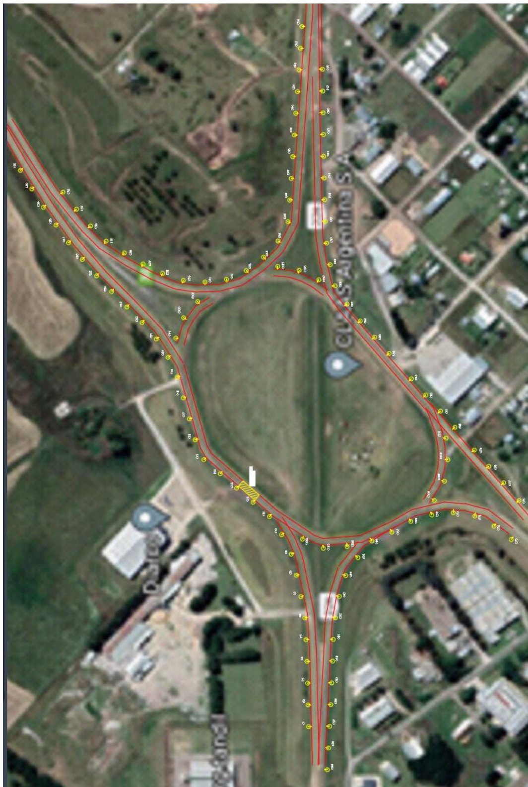
Imagen 4: Planimetría de Proyecto de Iluminación