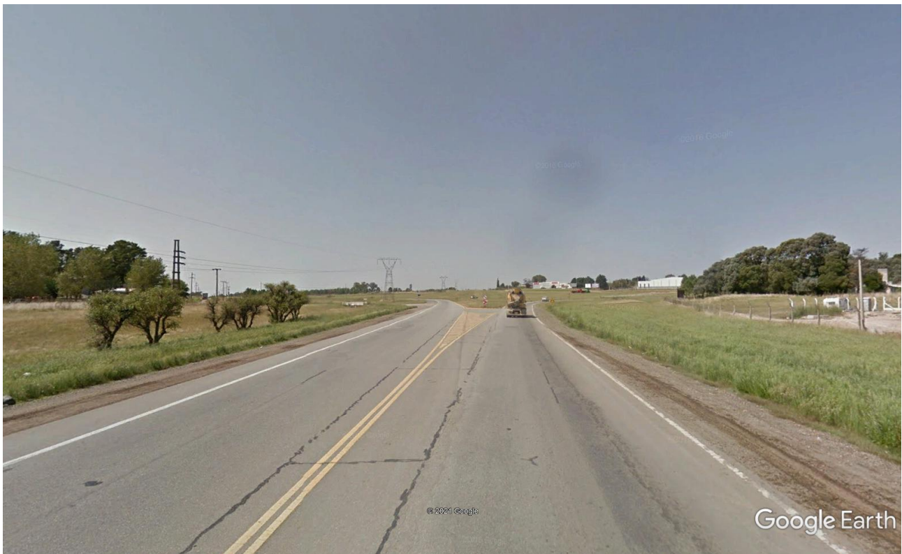
Imagen 15: Acceso Oeste