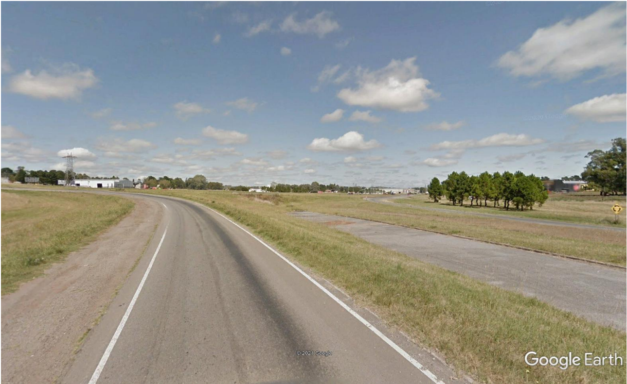
Imagen 6: Acceso Norte