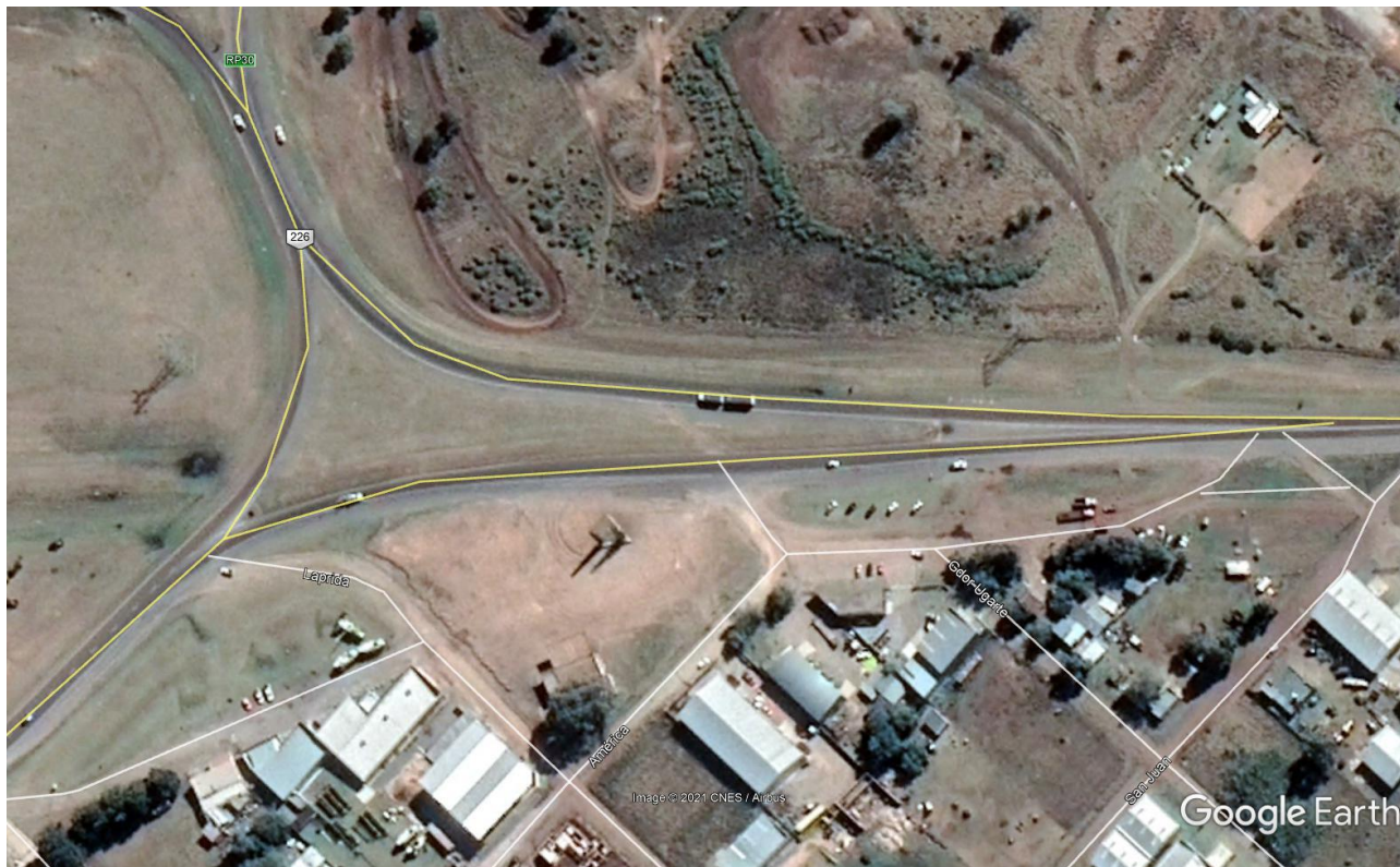
Imagen 8: Foto Aérea Acceso Este Rotonda