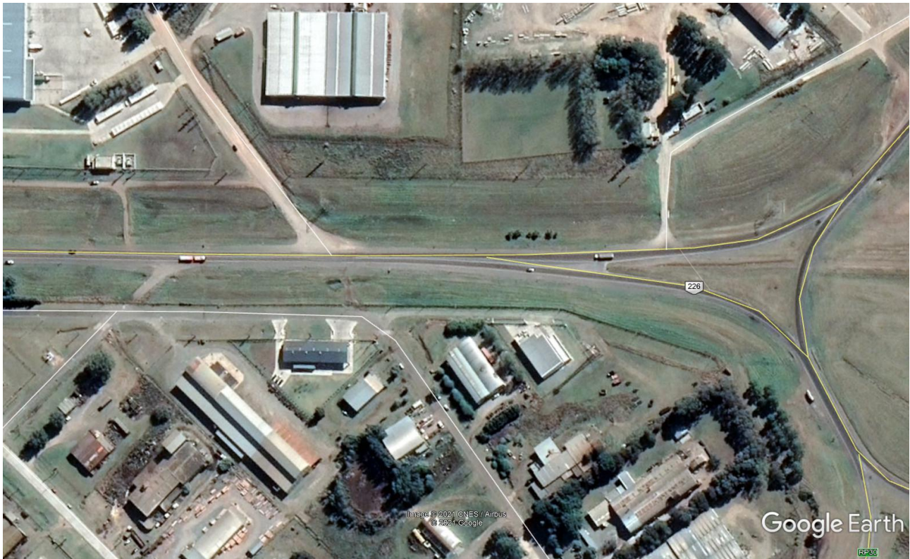
Imagen 14: Foto Aérea Acceso Oeste Rotonda