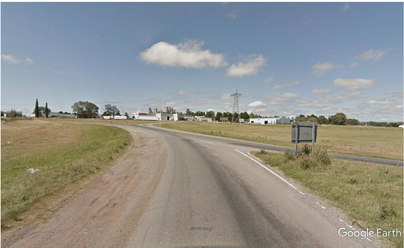
Imagen 7: Ramal de Salida de Rotonda hacia Norte