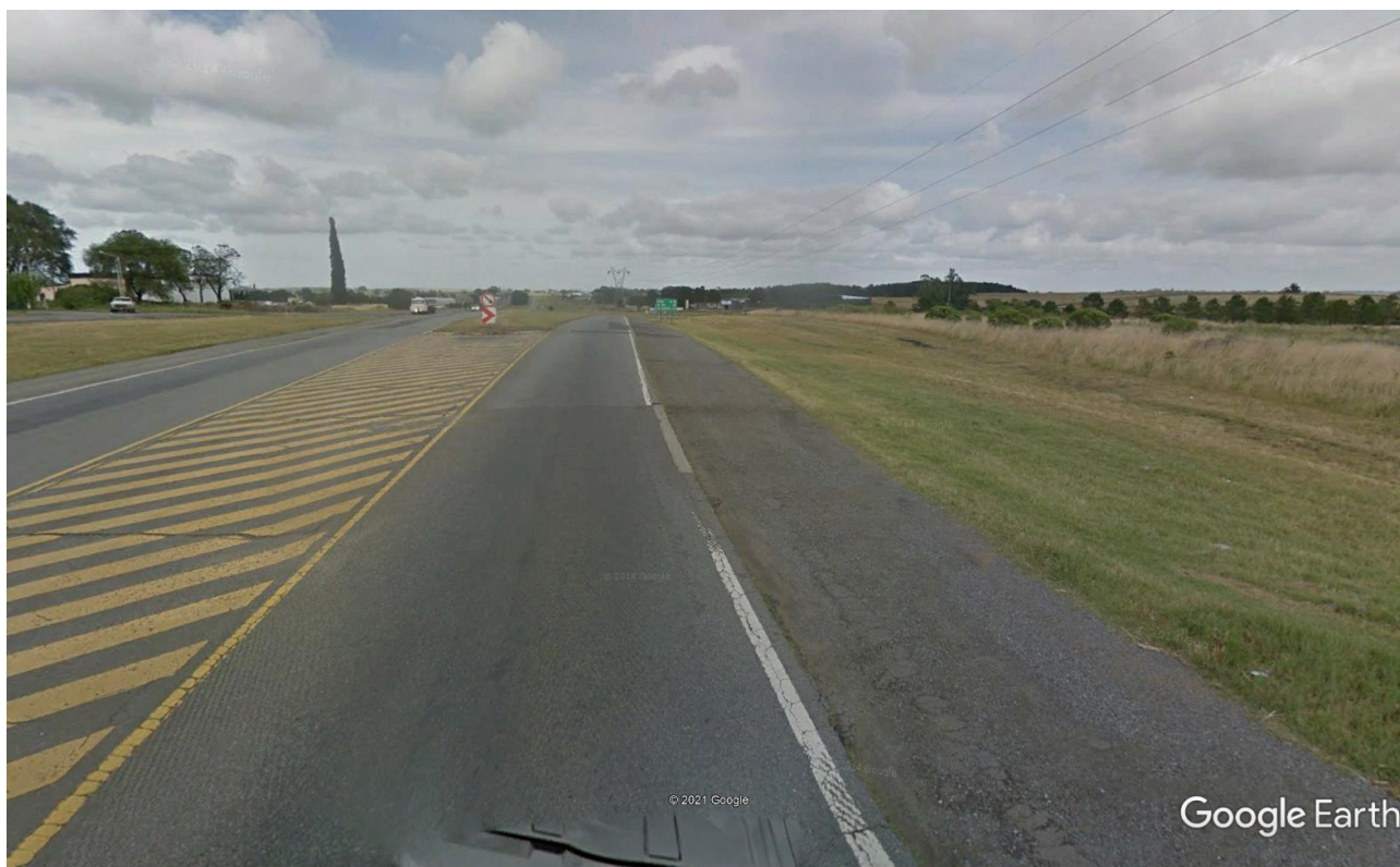
Imagen 9: Acceso Este