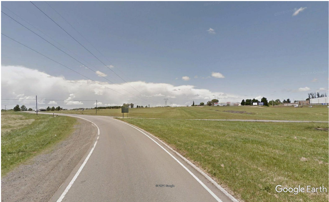
Imagen 16: Ramal de Salida de Rotonda hacia Oeste